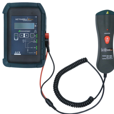
Bild 3: Batterieprüfgerät mit Temperatursensor METRATHERM IR BASE (Z680A)