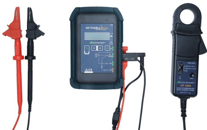
Bild 2: Batterieprüfgerät mit AC/DC-Zangenstromsensor CP1800 (Z204A)