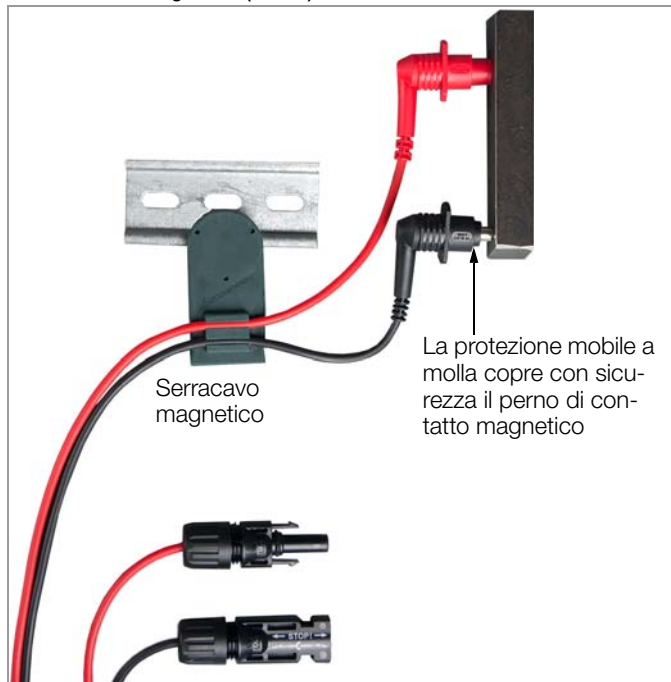
Puntali magnetici (brevetto) con serracavo magnetico (Z502Y)