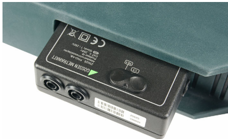
Bild 1 Ableitstrommessadapter am PROFITEST MXTRA

Vor Durchführung der Messung muss der Adapter mit seinen Messausgängen in die linksseitig am PROFITEST MXTRA bzw. SECULIFE IP liegenden Messeingänge (zweipoliger Zangeneingang und Sondeneingang) eingesteckt werden.